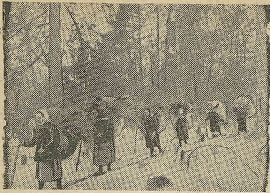
У ТЫЛЕ ВОРАГА. Н-скі раён Беларусі. Сяляне адной з вёсак пагналі ад немцаў сваю жывёлу ў лес. НА ЗДЫМКУ: Дастаўна кармоў жывёле.