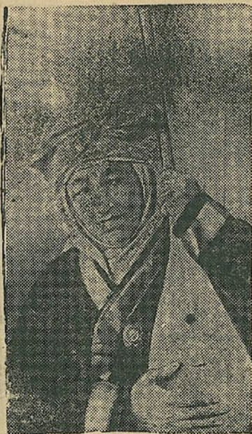
У Ташкенце адбылася декада савецкай музыкі рэспублік Сярэдняй Азіі.