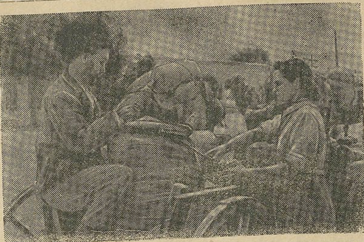
В Туркменистане идёт уборка урожая и сдача зерна государству. На снимке: колхоз «Ялкыч» привёз на заготовительный пункт первую партию зерна нового урожая.

Весенний сев колхоз провёл в благоприятное для каждой культуры время. Почву мы старательно обработали, хорошо унавозили местными удобрениями. Провели большую работу по уходу за посевами. Озимые и ярь были своевременно очищены от сорняков, что ускорило их рост и развитие. Залогом успеха на полях явились правильная организация труда и социалистическое соревнование, охватившее всех колхозников и колхозниц.