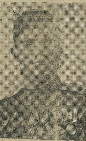
Двойчы Герой Савецкага Саюза гвардыі капітан І. І. Дзімітравіч Гулаеў. У баях з нямецка-фашысцкімі захопнікамі ён асабова збіў 57 варажых самалётаў. Тав. Гулаеў — уражанец станцыі Аксайскай, Аксайскага раёна, Растроўскай абласці.

Створым магутныя насенныя фонды для будучага ўраджаю з тым, каб не толькі выканаць, але і перавыканаць даваенныя пасейны клін на ўсіх культурах.