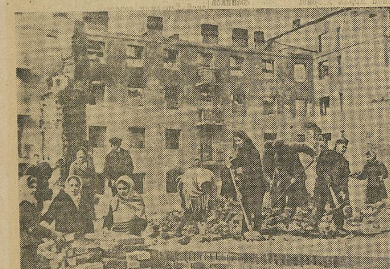
«Восстановим свой родной город! Сделаем его таким, каким он был до войны!» — говорят бойбручане. В свободное время тысячи домохозяек, рабочих, служащих и школьников работают на строительстве города.

С первых дней освобождения Несвижа началось восстановление памятников старины. Сюда приехала группа архитекторов, искусствоведов и художников. Райисполком выделил строительные материалы. Сейчас уже закончен ремонт фарного костёла. Ведётся восстановление Георгиевской церкви и триумфальных ворот.