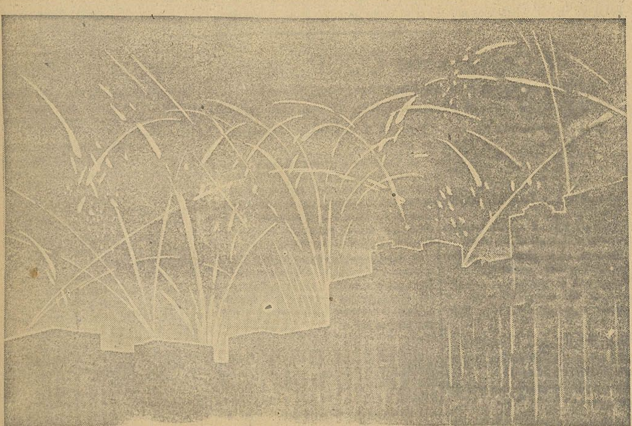
Мінск 9 лістапада. Сталіца салютуе ў чэсьць доблеснай савецкай артылерыі.

Работнікі швейнай арцелі «Новы шлях» Мінскага гарпрамааюза ў адказ на зварот работнікаў Магнітагорскага і Кузнецкага металургічных камбінатаў імені Сталіна абавязаліся выканаць гадавы план да 12 снежня і выпусціць дадаткова на 10 тысяч рублёў прадукцыі.