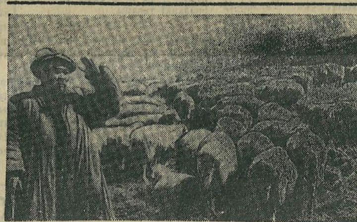
Тысячныя атары авечак калгаса „Бейпеке“ (Кемінскі раён, Кіргіская ССРСР) перайшлі на высокагорныя летнія выпасы.

інструктыўных нарад з калгаснымі агітатарамі па пытанню падрыхтоўкі да сяўбы і іншых гаспадарчых задачах. Зараз усе комуністы раз'ехаліся па калгасах і дапамагаюць калгаснікам наладжваць гаспадарку. В.Д.