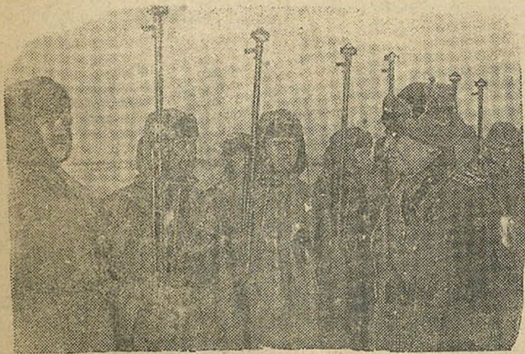
На тэрыторыі ССРС сфарміравана асобная югаслаўская добраахвотніцкая воінская часць.

Да канца навучальнага года мяркуецца стварыць выстаўку, прысвечаную лепшаму педагагічнаму вопыту.