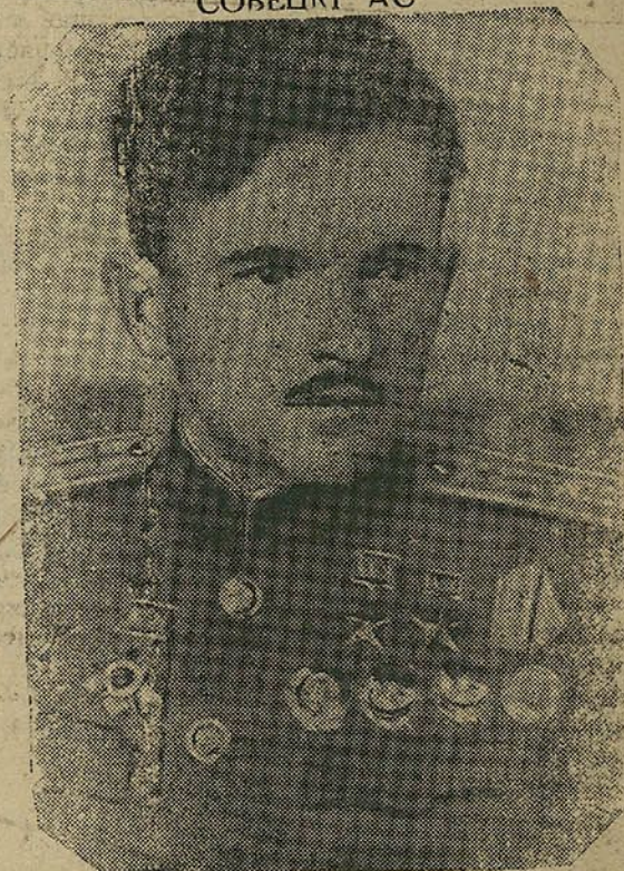
Двойчы Герой Савецкага Саюза Іюкрэшэў асабіста збіў 23 варожых самалёты і 7 — у групавых баях. На здымку: П. А. ПОКРЫШЭЎ.