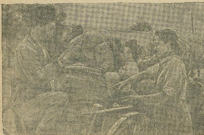
У Туркменістане ідзе ўборка ўраджаю і здача хлеба дзяржаве. На здымку: калгас „ЯЛКІМ“ прывіз здаваць зярно.